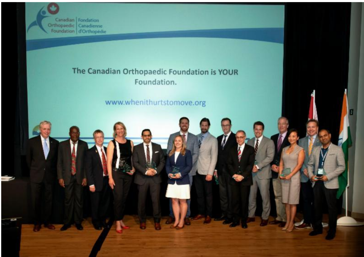
Un nombre impressionnant de chercheurs en orthopédie ont reçu leur prix ou bourse à la Réunion annuelle de l'Association Canadienne d'Orthopédie, à Victoria, le 20 juin 2018.