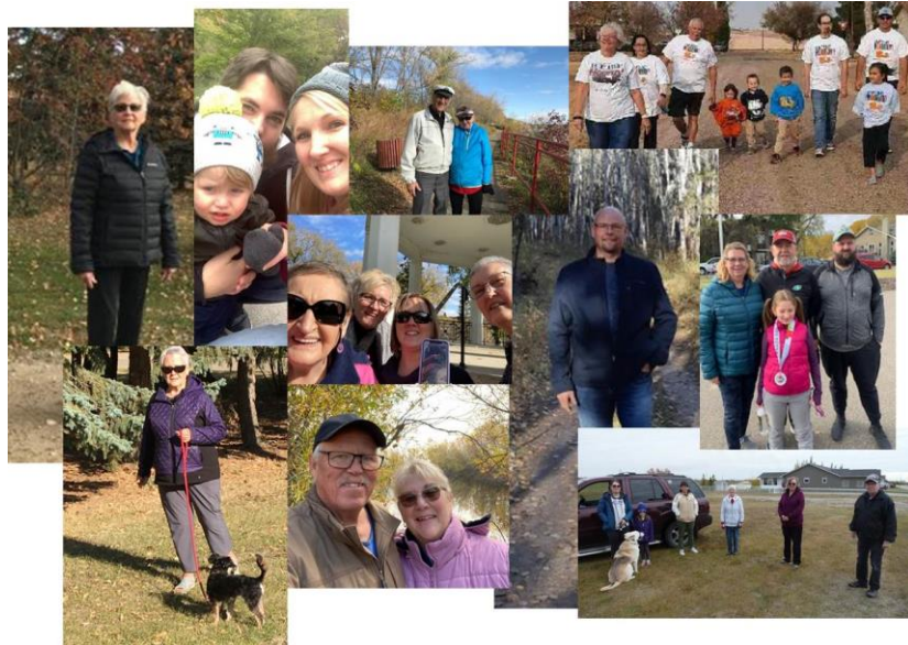
Marche virtuelle Hip Hip Hourra!

La marche et le Défi des pas ont permis de recueillir 18 000 $. Les fonds recueillis ont servi à soutenir les programmes nationaux de la FCO, de même que des programmes communautaires d'orthopédie.